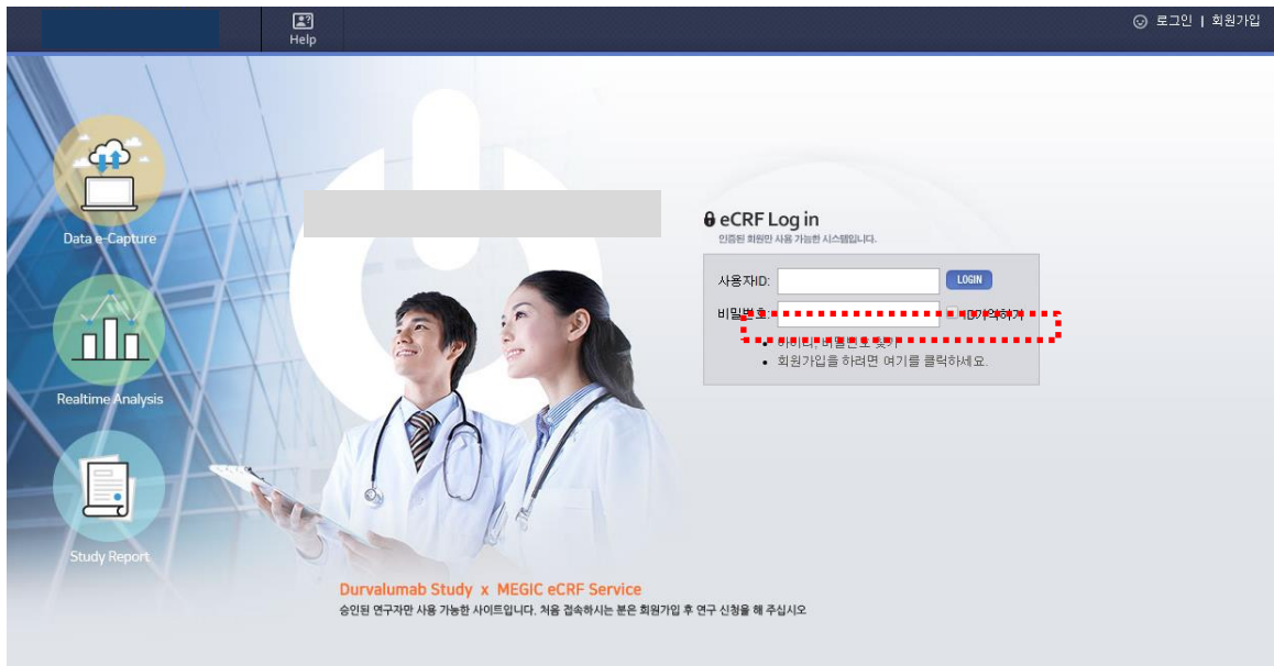
<그림> eCRF 홈페이지 로그인 화면

사이트에 가입되지 않은 연구자는 회원가입 링크를 통하여 계정을 생성한 뒤, 연구 신청을 해야 합니다.